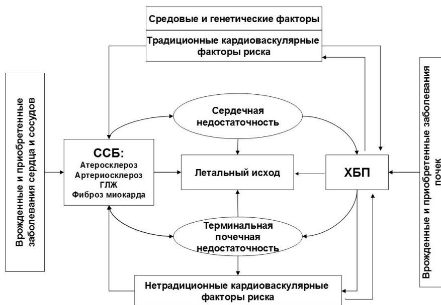
Рисунок 1. Схема кардиоренального континуума [28]

Примечание: ССБ – сердечно-сосудистая болезнь, ГЛЖ – гипертрофия левого желудочка.